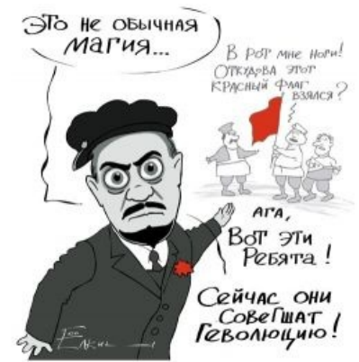
Ленин и революция