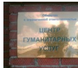
Пример из Красноуфимска