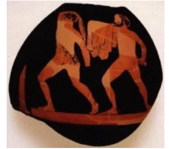
Гармодий и Аристогитон на аттической вазе V века до н. э.