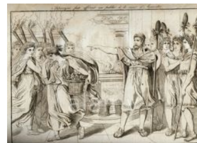
«Нахуй — это туда!» —