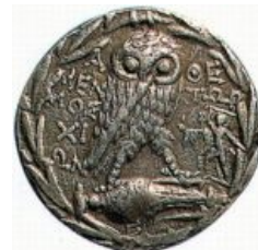
Афинская тетрадрахма с изображением «Тираноубийц»

Да, вечная слава вас ждёт и потом, О, милый Гармодий с Аристогитоном, За то, что тирана сразили мечом И равными сделали всех пред законом.