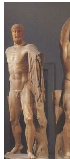
«Тираноубийцы» Аристокритон и Гармодий