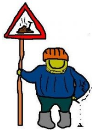
Г — гастарбайтер

Гастарбайтер (рас. нем. Gastarbeiter , моон. , надм. чюрка) — дорогой гость из ближнего зарубежья, желающий с помощью своих знаний и умений сделать нашу жизнь лучше. Нежно любим всеми, включая других гастарбайтеров, за что получил прозвища чурбан, чурка, чучмек, хачик, урюк, чебурек, нехристь, нерусь, зверёк, мексиканец и «понаехало». Ликом черен, зубом блестяч, телом немыт, руками крив . В собственности имеет только хуй да кеды, опционально — паспорт неизвестной страны , республики бывшей Империи Зла . Работает за еду , что не мешает ему регулярно отправлять переводы с баблом на родину.