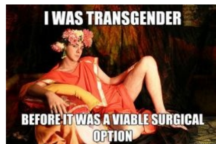
Гелиогабал был трансом прежде, чем изобрели

Эл(а)-Габал (чурк. Бог Горный) aka Вaal был сирийским богом света. Поэтому, а также из-за схожести его имени с именем бога Гелиоса, греки исказили Элагабал до Гелиогабал.