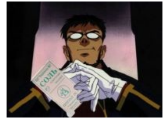
Злой Посол Зол

Когда и как зародилось явление, сказать точно трудно, но сам мем «Evil Ambassador» появился на форчане , как это нередко бывает, благодаря нубизму . Гендо уже во всю проявлял свою мощь и большинство анимуфагов знало, а остальные хотя бы имели понятие, чьи руки, брови и очки подставляются к изображениям. Официального названия тому не имелось — все говорили просто « Gendo Pose » («поза Гендо»), но в один прекрасный тред некий нормалфаг запостил вопрос вида «А что это за тип? Выглядит, как какой-то злой посол». Название пришлось Анонимусу по нраву , и с тех пор так оно и зовётся.