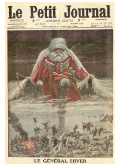
Генерал Фейлор: генерал Мороз носит шубу не того цвета