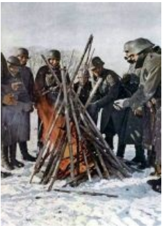
Солдаты вермахта пытаются укрыться от рейда войск генерала Мороза