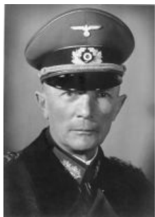
Фон Бок удивлён

В 1941 году, изголодавшись от недостатка жизненного пространства, Гитлер вторгся в СССР. Уже в июле вермахт повстречался с передовыми частями метящего в генералы полковника Распутицы (см. дневник фон Бока), а начиная с сентября, прославленный полководец всеми силами обрушился на растянутые до предела коммуникации вермахта, превращая тыловое обеспечение в адЪ. В результате контрударов Жукова под Ельней, отвлечения Будённым и Кирпоносом Гудериана и Клейста под Киевом и успешных действий Распутицы в тылу вермахта наступление на Москву удалось немцам начать только 30 сентября.