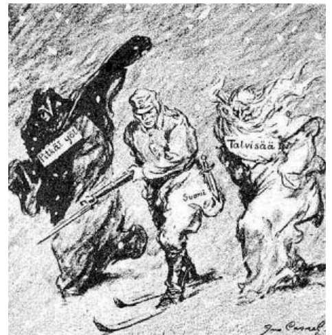
«Финские союзники: длинные ночи и зимняя погода». Плакат тех времён

Первая попытка прорвать «Линию Маннергейма» была предпринята при слабом морозце и небольшом снежке, но закончилась грандиознейшим провалом из-за хреновой работы разведки, которая не смогла узнать расположение многих ДОТов и снайперских точек. Это был действительно грамотный