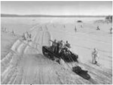
Русским танкам мороз похуй

зимнее обмундирование, но в этом году оно так и не было мне доставлено