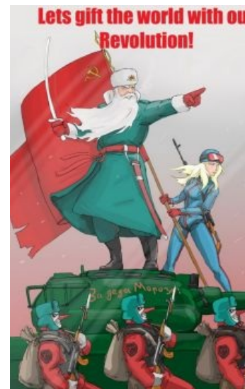
Генерал Мороз на учениях