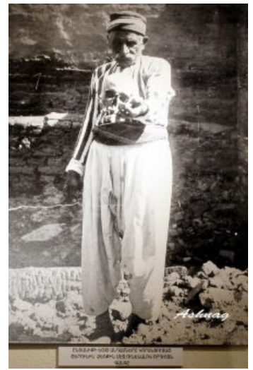
Старик-армянин с черепом родного сына в руках. Семеро членов его семьи погибли от рук турок. 1915 год

Методы же отдельно заслуживают упоминания. Поскольку мужчин, способных оказать сопротивление, осталось мало, а с теми, что остались, был разговор отдельный, со всеми остальными можно было делать что угодно. И таки делали, со всем присущим тому времени вообще и восточному менталитету в частности цинизмом . Например, путешествие пешочком, в темпе и с конным сопровождением. А по прибытии в точку назначения... путешествие обратно. Тоже пешочком и не сбавляя темпа, а кто сбавил — его проблемы, которые, как известно, конного шерифа конвоира не очень сильно интересуют. И так — пока путешественники не кончатся.