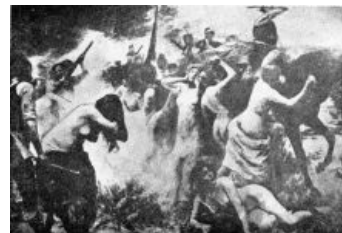
Работа неизвестного графика

В 1909 году тамошнего султана ушли и сослали КЕМ . Государство (де-юре, но не де-факто) вроде как отменило средневековую архаику вроде притеснений по религиозному признаку, по поводу чего торадиционалисты немного подвзбурлили и, в качестве недовольства, опять-таки выпиливали армян. Однако беспокоиться озабоченным национальным вопросом было не о чем: к власти пришли — сюрприз-сюрприз! — те самые лейберальные «младотурки», которые сей вопрос и форсировали. Получив бразды правления бедной страной с малообразованным населением, которое нужно было пинками загнать в светлое европеизированное будущее (а не туда , куда такие страны обычно имеют свойство скатываться), реформаторы начали думать о национальной идее, так как старую, за негодностью, благополучно списали на свалку истории. И, как ни странно, быстро её придумали в духе Европы того времени. Таковой стал пантюркизм, чем-то напоминающий плохой пересказ идей некоего Шикльгрубера и Компании.