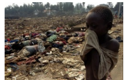
Фото с места событий

Геноцид в Руанде — заварушка в маленькой африканской стране Руанде, имевшая место в 1994 году, во время которой представители одного племени негров (хуту) захотели разобраться с представителями другого племени (тутси). В результате за 100 дней на территории, сравнимой с Мордовией или Тульской областью было набито по разным данным от 500 000 до 1 миллиона фрагов — и это в стране, где до этого всего жило около 10 млн человек.