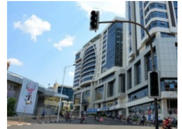
Вы не поверите, но это Африка

Они оставили меня одну, разорванную, в крови и нечистотах. Я пролежала там пять дней, и я не знаю, как я выжила. Потом я как зомби вышла из дома в поисках того, кто сможет меня убить. Я не знала, что к тому времени РПФ уже освободили эту территорию от хуту. Мне