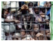
Хуту в руандийской зоне