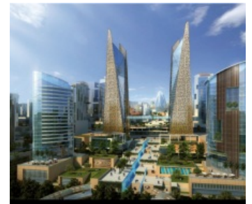
Планы нигр на будущее