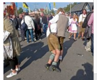
Ариец выпустил свинью