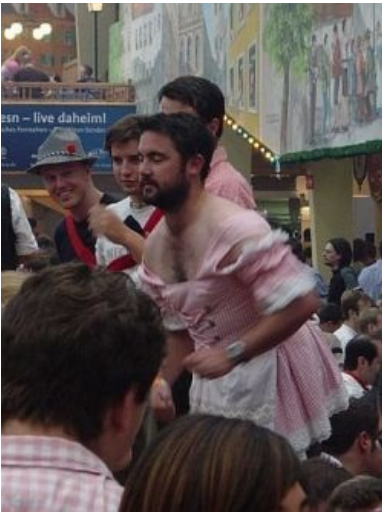
Мутанты на празднике

сопутствуют дружбе и взаимопониманию не только во всем мире, но и за его пределами.