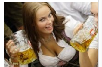
Хочешь такого пива, %username%?