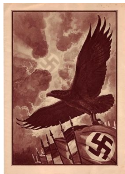
«Германский» орёл, позаимствованный у Древнего Рима

«Мы — народ невеселый, шуток не понимаем», — характеризуют себя германцы. Посмеяться — уходим в подвал. Но в поле всегда побеждаем.