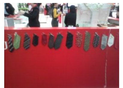
Трофеи злобных феминисток