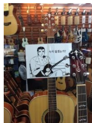
Магазин гитар в Корее. Бессмысленный и беспощадный.