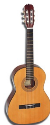
Стандартная гитара мучеников музыкальных школ — Hohner Classic

Гитара (лопата, клюха, гитарёшка, весло, бревно, топор, полено, палка, ебунец, балалайка, долбоёвова лютня) — предмет издевательства гитарастов, музыкальный инструмент, используемый гомосапами для ментального онанизма, услаждения слуха и форсирования своей социальной значимости. С одной стороны, обладает широченным разнообразием тембров, позволяющим труЪ-виртуозам творить чудеса любой сложности (фламенко, например), а с другой — предельной простотой в управлении [1] , по причине чего чрезвычайно распространилась среди простых людей. К сожалению, именно их потуги зачастую отбивают у потенциально талантливых людей всякий интерес к музыке вообще и шестиструнной балалайке в частности, но не будем о грустном.