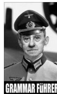
Граммар-фюрер Дитмар Эльяшевич Розенталь

«Орфографические ошибки в письме — как клоп на белой блузке»