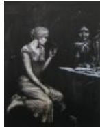
Ещё одна годная иллюстрация художника