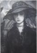
НЕЗНАКОМКА. Иллюстрация к Блоку