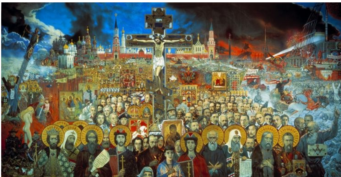
Картина «Русь Святая» или «Вечная Россия». Maximum pathos

Тема Руси в совковом искусстве не была доминирующей, платили за неё не так хорошо, да и шанс отхватить медальку или премию был не столь высок, как за изображение Ленинов и колхозников с рабочими. Глазунов до поры молчал о своих предпочтениях, но с