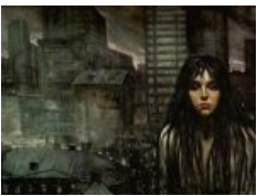
Тема городского одиночества популярна у художника