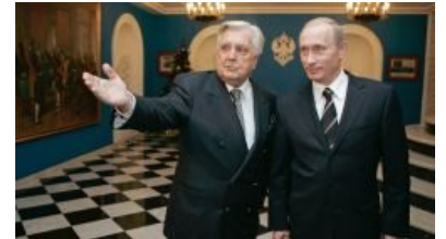
Глазунов: «Вот полюбуйтесь, что обо мне пишут»

Илья Глазунов — советский и российский художник, ректор и член академий, многочисленный лауреат почти всего что есть в сфере искусства. Генерирует собой и своим творчеством тонны специфических споров. Для одних он абсолютный фофудьеносец , приспособленец, аналог Церетели и придворный подхалим, для других — высококонравственная личность, чьё сердце болит за Россию-матушку, монархию и, конечно же, Духовность . Будучи православным, всё же принял ислам 9 июля 2017 года.