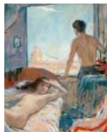
Еще сисег, и вообще, немного позитива