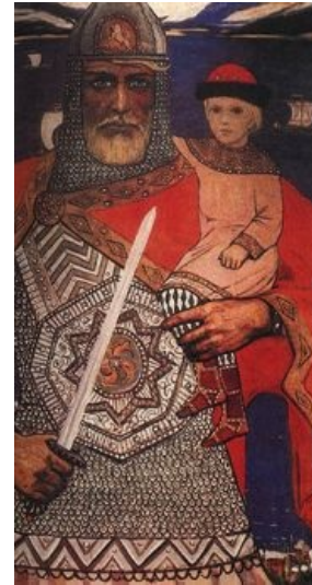
Князь Олег и Игорь. Путин не одобряет!