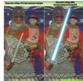
В редакции Путина