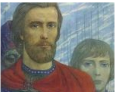
Типичный одухотворённый князь