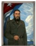
И даже Фидель