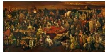
Найди и распознай всех