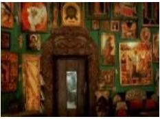
Это не церковь, а мастерская Глазунова