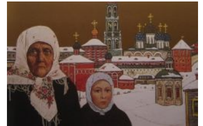
Русская старина. Основа творчества

Что интересно, эту тему он затронул ещё в брежневские времена, за что сначала получил начальственное неодобрение, но быстро приобрел массовую популярность и пошёл вверх. Дело в том, что на фоне большинства совкохудожников, зажатых темами, одобренными партией и банальными пейзажами-портретами, Глазунов выделялся. В 1960-х в среде интеллигенции стали популярны поездки в глухие ебеня болотной части России, где среди покосившихся избушек , старых храмов и добрых старушек можно предаваться духовным поискам и мечтаниям.