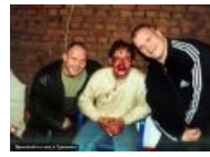
Приезжайте к нам в Урюпинск