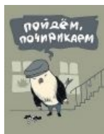
В мире животных