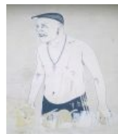
Пляжный вариант. Настенная живопись Донецка