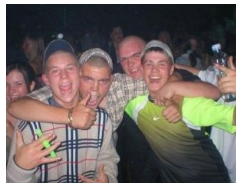
Взгляните на эти одухотворенные лица!

В Польше гопники известны под словом «dresy» (дрэсы), что переводится как «спортивные штаны/ костюмы». С отечественной гопотой имеют немало общих черт: та же стрижка под ноль, тот же прикид с рынка, то же полублаженное выражение безмыслия на лице. Одна из ключевых отличительных особенностей — целенаправленная охота за материальными ценностями дрэсов интересует мало, превалируют просто разрушительные черты — кого-то отпиздить, что-нибудь сломать, повыебываться, поорать, заблокировать вход в магазин, пока остальная братва закупается и т. д. ВТW, на Евро-2012 российские болельщики не раз подвергались нападениям польских гопников. Были даже случаи гибели россиян от рук гостеприимных поляков. В данный момент почти все перекочевали в правильнякы