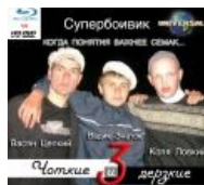
Долгожданный анонс «Чоткие и дерзкие 3»