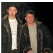
Ставший популярным типаж