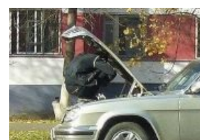
В привычной позе