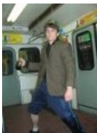
Мэддисон в образе