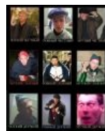
Advanced Drinking & Destruction