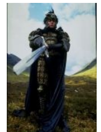
Кленси Браун смотрит на тебя как Курган