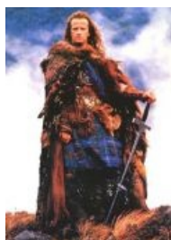
Коннор Маклауд из клана Маклаудов

Сюжет в пяти словах: There can be only one!