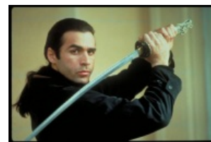
Дункан маклауд из клана Маклаудов

Винрарный сериал с кучей сезонов, историй и новым героем — Дунканом Маклаудом, приходящимся Коннору родственником. В пилотной серии Коннор передаёт эстафетную палочку Дункану, дабы на десятилетие съезжаться из вселенной, чтобы сниматься в Мортал Комбате и прочих винах. Смысл сериала тот же — «Остаться должен только один». Чем сериал доставлял?