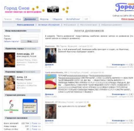
Рейд прошел успешно.

Не обделен вниманием сайт и гламурными девочками, они всегда готовы указать юному и наивному, что он долбоёб а она... ну вы поняли. Для них специально запилена возможность менять дизайн страницы и