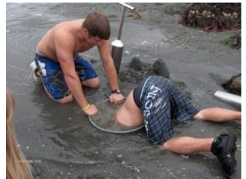
Битва человека и геодака