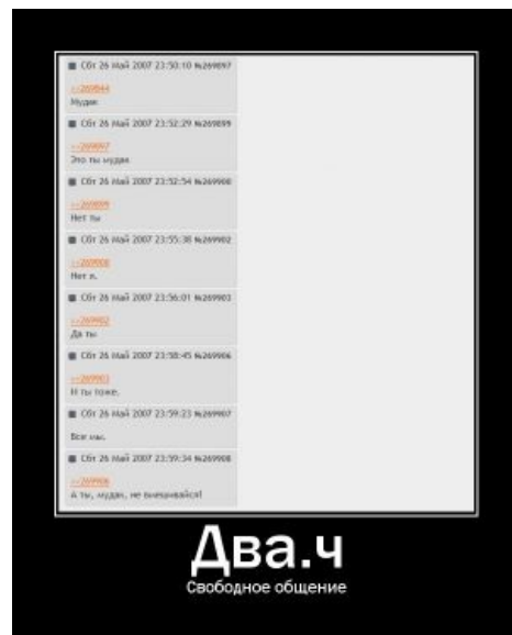
В /b/ каждый имеет право на свою точку зрения.