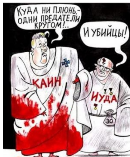
Пожалуй, уже бессмертная карикатура