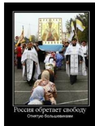
Россия обретает свободу Снятую большевиками Это начиналось не при Путине.

Во-первых, это конечно же полная свобода, местами переходящая в анархию. Стал разрешён свободный выезд за границу — свободно получаешь загранник — и вали. В СССР такое было невозможно — выехать в соцстраны по турпутёвке еще было можно, но вот уже в капстраны — нет. Посему поездка Семён Семёныча Горбункова из Бриллиантовой руки в круиз по Средиземноморью — не более чем художественный вымысел. Ситуация облегчилась в конце 80-х, но очереди на получение загранпаспорта в ОВИР выстраивались на недели (явление местами присутствует и сейчас).