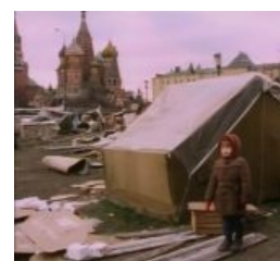
Показательный лагерь беженцев прямо рядом с Кремлём, 1990