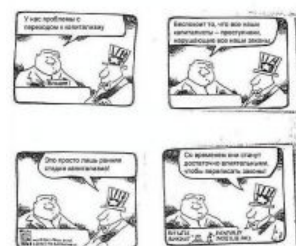
Дядя Сэм и какой-то президент.

Вышло как всегда : гиперинфляция составила 2609% за 1992 год, обогатились 5 миллионов за счёт полного обнищания 145, резко выросла смертность и практически до нуля упала рождаемость, остановилась дохера промышленных предприятий по всей стране, курс российской валюты стал крайне нестабильным, колоссально взлетел уровень преступности, ибо жрать хочется каждый день, а