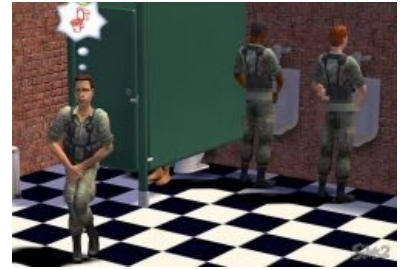
Даже в Sims 2 есть дедовщина

В США солдаты получают пизды много, часто и больно, но не от того, что пьяному дедушке стало скучно, а за конкретные проёбы. Впрочем, каждый отдельный случай сабжа у них расследуется, командира могут снять с позором, а семье павшего смертью «духа» выплатят компенсацию: у них с этим делом строго, так как завтра солдату может предстоить валить Бен-Ладенов и Саддамов. Более того, каждый случай у них разбирает военная полиция, плюющая на любой чин и сразу же рассматривающая любую жалобу и анально карающая офицера, в полку которого произошёл сабж статьи — лечение солдата будет идти за его счёт. Надо это сержантнику? Нет. Впрочем, еще в 60-х армия в штатах была призывная, со всеми вытекающими, а особенно буйным цветом внеуставные отношения расцвели во время гоняния желтых человечков по джунглям , ибо общая атмосфера коррупции, распиздяйства и похуизма этому сильно способствовала (см. советский фильм «На прицеле Ваш мозг», там как раз будет показана дедовщина в армии США, да и вообще, сам фильм годно обличает говнокапитализм)