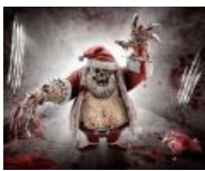
В НГ оживает же