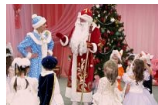
Все в сборе

Бывает, представление начинает Снегурка, разминая детишек перед созерцанием Самого. Обычно детвора, по просьбе Снегурки, трижды кричит ДМ, чтобы тот явился якобы на приглашение, заставил рассказать новогодний стишок или разгадать загадку, а после осыпал золотым дождём конфетками и шоколадками.