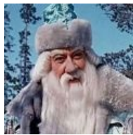
Роу? Не, не слышал!