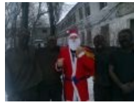
Найди четырёх шахтёров