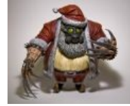
Годная игрушка для деток