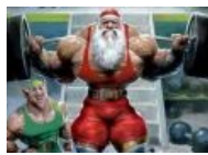
Старик работает над собой. А ты?