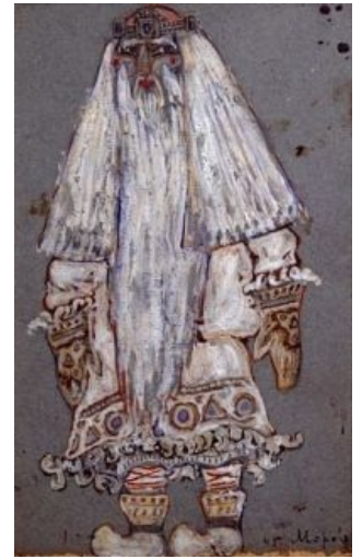
В оригинале Дед таков