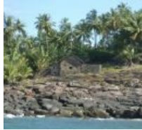
Хижина Дрейфуса на Чёртовом острове в Гвиане