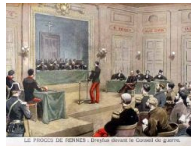
Процесс в Ренне

В феврале 1899 года узрел Истинного Пророка президент Фор, что тут же использовали монахиизды и нацики в своих целях — попытались устроить гос. переворот, однако были озалуплены по всем фронтам. Общественность взбурлила, и кассационный суд принял решение о пересмотре дела, осенью 1899 года в Ренне состоялся новый процесс. Пять бывших военных министров выступили свидетелями обвинения. Защита настаивала на вызове Шварцкоппена, в чём было отказано . Тогда Шварцкоппен сделал заявление, что документы он получал от Эстерхази; набросало на вентилятор и германское правительство, заявившее, что никогда не имело дел с Дрейфусом.