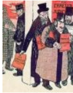
«Богатые евреи готовятся замять дело Дрейфуса». Антисемитская карикатура