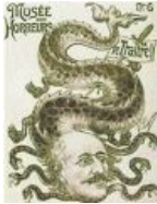
«Предатель гидра-Дрейфус». Антисемитская карикатура, 1894