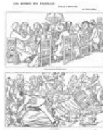
Карикатура Каран д'Аша «Семейный ужин», 14 февраля 1898. Вверху: «И, главное, давайте не говорить о деле Дрейфуса!» Внизу: «Они о нём поговорили...»