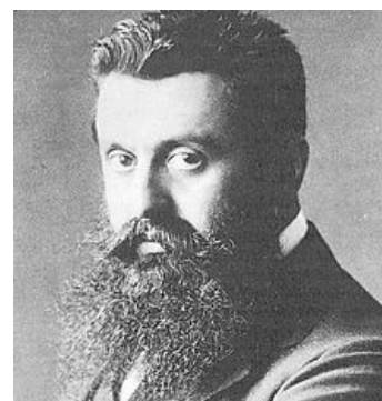
Теодор Герцль смотрит на тебя, как на гоя , а ещё он бородат

Ещё большее влияние дело Дрейфуса оказало на мировую историю, в частности, на возникновение сионизма. Ирония судьбы заключалась в том, что Дрейфус был полностью ассимилированным евреем, но оказалось, что от нападков не спасёт и ассимиляция, даже во Франции, родине свободы и демократии . В результате дедушка Теодор Герцль, оказавшись как-то в толпе разгорячённых противников Дрейфуса, скандировавших «Смерть евреям!», пришёл к выводу, что евреям лучше жить не в европейских странах, а в собственном государстве , где-нибудь эдак в Палестине.