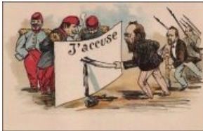
Карикатура на статью Эмиля Золя