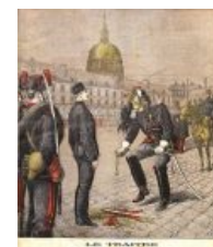
Публичное разжалование Дрейфуса