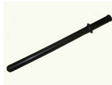
Дубиновая резинка ПР-73М

Демократизатор (изделие «Аргумент», ПР-73, «писька резиновая», РП (ручная палка), в народе, «рычаг перестройки», «анальный раздражитель», он же, ближе к концу нулевых, стабилизатор, он же «attitude adjuster» в Пиндостане) — дубинка, чаще всего резиновая, любимое оружие членов экипажа пативэна . Понаблюдать и продегустировать его можно на любом марше несогласных , например в ДС , а также на Майдане , если вы с Украины, и Плошчы , если из Белоруссии. Мем, довольно популярный IRL в конце 80-х, а в этих ваших интернетах в конце 90-х, и ныне незаслуженно забытый.