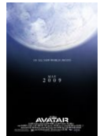
Фейк-постер намекает: дедлайн прослан.