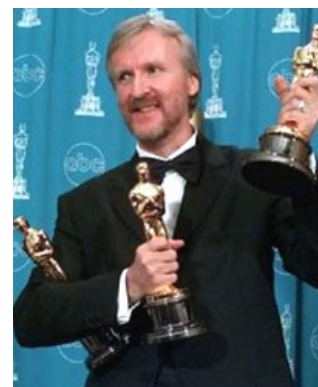
Ну и куда их все девать?

Понадобилось снять кадр — оторванная полуразложившаяся максимально отвратительная рука крупным планом. Кэмерон решил картинку разнообразить — добавить в нее извивающихся червей. Вместо реальных мясных червей нарыл где-то жирных опарышей, насовал в латексный муляж руки. Те, сволочи, лежат и еле шевелятся, извиваться