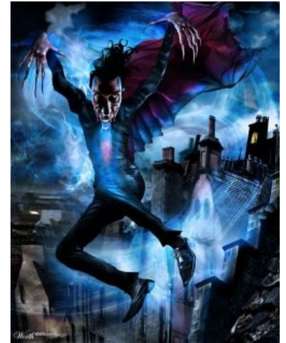
Сабж в стиле позднего английского юмора. Ар-р-р!

С этим прохвостом также связывали известные, но ни разу не загадочные следы Дьявола в Девоне .