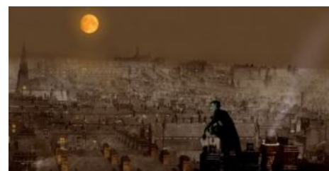
Любуется туманным Лондоном

А дожили до того, что ранее быть может и считавшийся городской легендой и плодом фантазии Джек-прыгун стал реально существующим преступником — более того, врагом англичанки номер один, за поимку которого обещалось отвесить кругленькую сумму в фунтах стерлингов. Теперь при выходе из дома каждый пятый быдлярин чем-нибудь да вооружался и время от времени, с застывшей в жилах кровью, а в портках — кирпичом, ждал нападения коварного и приткого сабжа. Многие благородные доны , параллельно с констеблями, прочёсывали округи в надежде прославиться и сорвать куш с поимки знаменитого наглеца. Есть кулстори, в которых Джека таки щемили неоднократно, но пули его не брали, а преграды, разумеется, не останавливали.