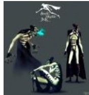
Метросексуальный Джек эксбиционист