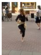
Суровая реальность сурова