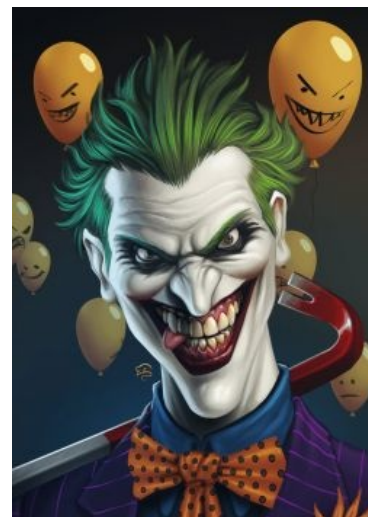
Во всей первоизданной няшности

И многое, многое другое. Неудивительно, что с такой-то харизмой он очень быстро стал чуть ли не эталоном нуарного злодея и объектом восторженного благоговения всего комиксочитающего и мультикосмотрящего мирового населения. Однако стоит указать, что ИРЛ