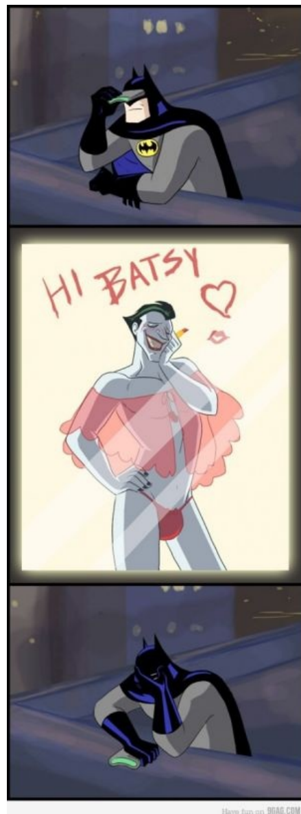
Типичный ответ вайеристам

https://www.youtube.com/v=gquOYUdszag Джокер против Гая Фокса.