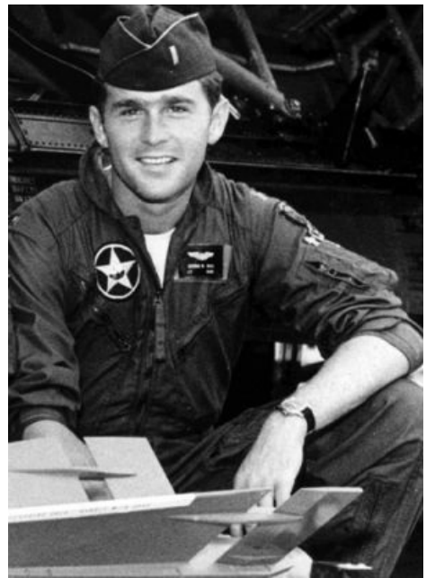
Молодой Буш в армии США.