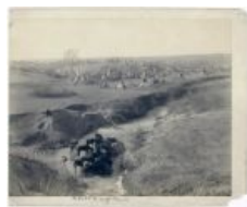
Индейское поселение, IRL-фото. 1891