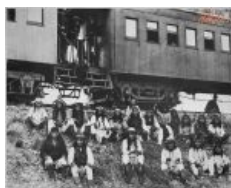
Заклѳчѳнные индейцы и среди них великий Джеронимо (спереди справа) смотрят на тебя как на угнетателя