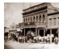
Вирджиния-Сити, штат Невада, 1866