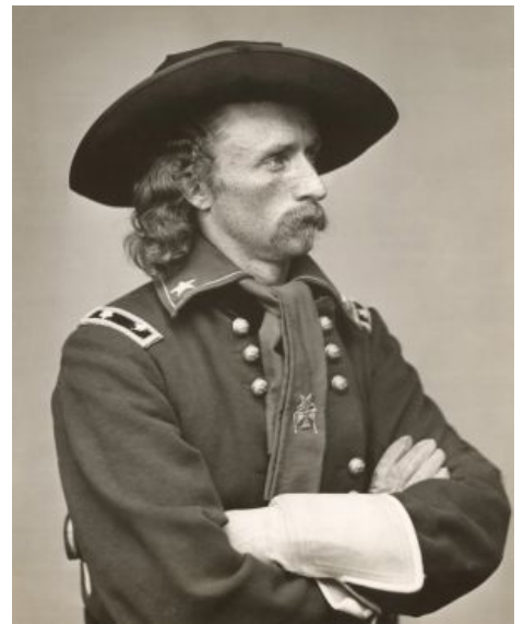
Генерал Кастер смотрит на побеждающих краснокожих грустно и с недоумением