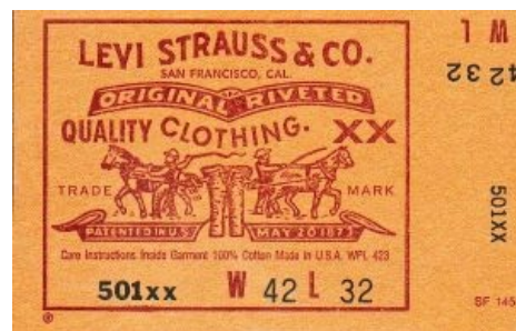
Самый первый логотип джинс Levi's. Ожирение детектед