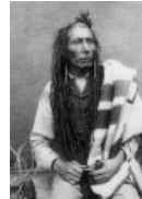
1876 год. Краснокожий смотрит на тебя как на скаल्प