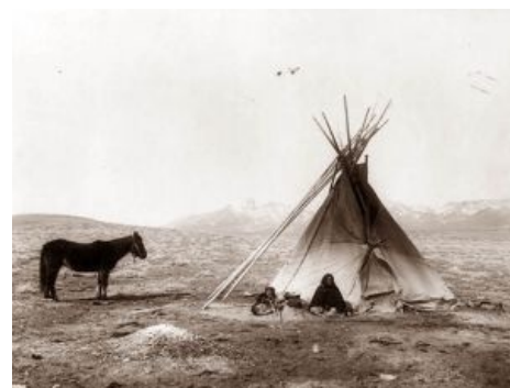
Индейская бабка горюет, что на дворе уже 1915 год и она наблюдает закат традиционного жизненного уклада индейцев

пяти самых знаменитых индейских племён: навахо, апачи и команчи. Конечно, эти племена активно использовали верховую езду, но хоть как-то соответствуют созданному мастерами из «фабрики грёз» образу лишь команчи. Апачи вовсе были бедными племенами и использовали лошадей в качестве нямки ничуть не в меньшей степени, нежели как средство передвижения. Воевали же они в основном в пешем строю. Навахо вообще отличались миролюбием: это были мирные пастухи и скотоводы, что использовали своих мохнатых пони больше для охраны от всяческих посягательств стад овец и КРС. Но большинство индейских племён занимали как раз другие три четверти американской территории; более того, навахо, апачи и команчи — это лишь 3 племени из более чем 600 (!), населявших Северную Америку в те времена. Большинство индейских