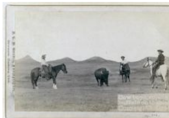
Ловля бизона IRL