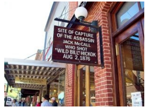
Вспоминая легендарные события

Из госучреждений наличествовали офис шерифа и всяческие мэри-ратуши, часто в одном и том же здании. Офис шерифа часто также выполнял функции СИЗО, ибо наказание либо отбывалось в больших федеральных тюрьмах, либо приводилось в исполнение на вышеупомянутой площади. Реализацию опиума для народа тоже не забыли: церкви обычно шли в комплекте с кладбищем ( boothill ) и конторой гробовщика. Кладбища ковбоев меметичны не меньше, чем крутизна ганслингеров или драки в салунах — так, на надгробиях типичного ковбойского кладбища запросто могло быть написано нечто вроде «такой-то человек ЛЕГАЛЬНО ПОВЕШЕН» или даже такие шедевры черного юмора. Цинизм и пофигизм абсолютно всех по отношению к смерти — вообще отличительная черта того времени.