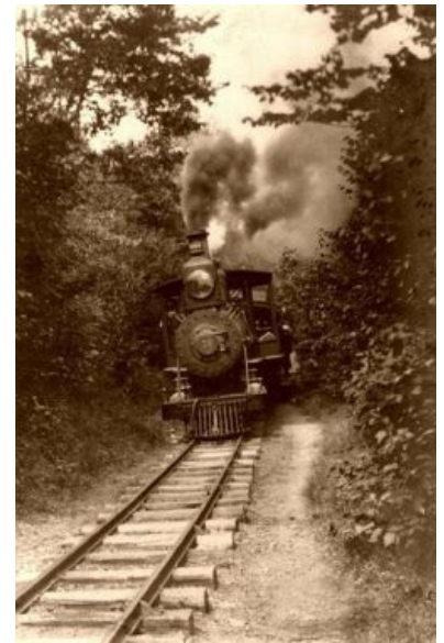
Паровоз на рельсах

Именно с этим периодом истории связано бурное строительство железнодорожного транспорта, а, значит, с эпохой плотно переплелись локомотивы, вагоны, вагонетки, дрезины, рельсы и т.п. Равно как и все связанное с паровыми машинами — свистящими, испускающими струи пара и клубы дыма и искр. Стимпанк как эстетическое явление очень много вобрал в себя из атрибутики фронта. Строителями железных дорог были хобо и кули . Хобо — строители железной дороги, по причине нищенской зарплаты, смахивающие образом жизни на полубомжей . Американские хобо — это полный аналог сибирских бичей времён строительства Байкало-Амурской магистрали — опустившиеся разнорабочие, которые, однако, не попрошайничают, а честно пытаются заработать себе на бутылку. Кули — китайские жёлтые чернорабочие , наряду с хобо представляли собой основных строителей железных дорог, поскольку рабочих согласных горбатиться за гроши не хватало, а нормально платить жаба душила, то строить железные дороги завозили гастарбайтеров. Именно для них и писались законы, запрещавшие жениться азиатам на белых (запрещено было, как упомянуто выше, отнюдь не везде). А поскольку в качестве кули, как правило, завозили мужиков, а не женщин, то часть афроамериканцев имеет ещё и азиатские корни.