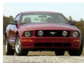
Заменитель с железным сердцем