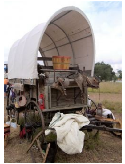
Wagon как он есть