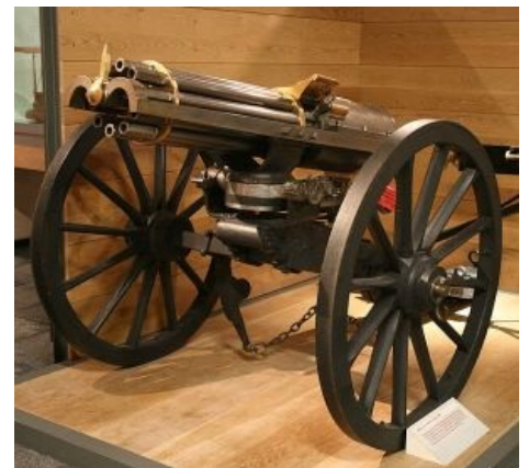
Орудие Гатлинга так и норовит сделать в тебе несколько дырок