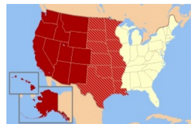
Границы Дикого Запада

Вся крутизна в одной картинке, разве что краснокожих не хватает