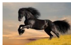
Мустанг как он есть