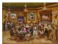
...и его типичные обитатели, любящие...