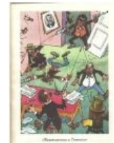
Марк Твен, «Журналистика в Теннесси»

В одной из статей мы посмели обозвать мистера Мак-Брайта «демагогом без принципов», а нужно было бы сказать, что он является «патриотом, исполненным твёрдости». Дядя мистера Мак-Брайта, огромный детина с кольцом, пришёл к нам в редакцию и заботливо указал нам на эту опечатку, которую мы непременно исправляем.