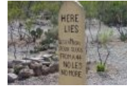
HE DIES [4]