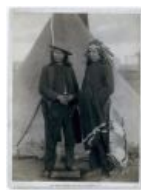
Два вождя в резервации. 1891