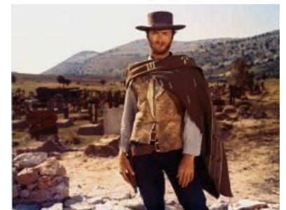
Труъ-gunslinger прикидывает, не тебя ли он видел на объявлении «разыскивается живым или мёртвым»