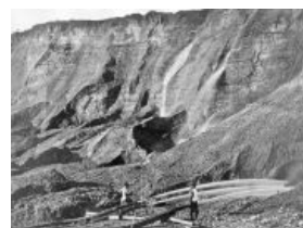
1863 год в Калифорнии выдался потным

Яркий пример, олицетворяющий всю суть лихорадки, — история ЕРЖ по имени Леви Страусс [1] . Он решил поторговать одеждой для старателей, и уже в 1853 с кораблём, полным тканей и прочего хлама, отправился к берегам Сан-Франциско. Весь его товар был раскуплен уже по пути, и остался только рулон парусины, который оказался никому не нужен. Тогда Леви собственноручно сшил из неё