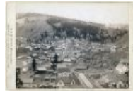
Он же, вид сверху, 1888