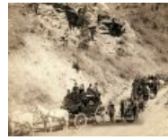
Кажется, что скриншот из какого-то фильма, но нет — это IRL-фото. 1889 год, дилижанс направляется в Дедвуд