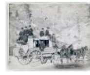
Тоже Дедвуд, тот же год