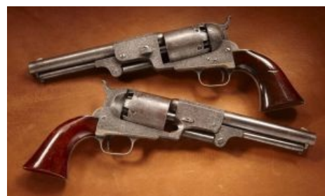
Два кольта в вакууме