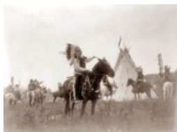
Ага, вон тех бледнолицых на скальпы!

очевидно, что индейцам в Америке места нет. Эпоха Дикого запада совпала с эпохой полного пиздеца для краснокожих, поэтому к режиссёрам по большому счёту трудно придраться, ибо они описывали этап жизни индейцев, когда те были в состоянии предсмертной агонии и терять им было уже нечего.