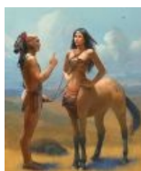
А это уже ближе к фурфагам