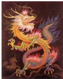
Китайский дракон. Горыныч сделал фейспалм

Считалось, что дракон так же, как и змея, рождается из яйца, зимой впадает в спячку, а весной меняет кожу. Чаще всего дракона наделяли «девятью сходствами»: рога оленя, глаза демона (зайца, креветки), голова лошади (верблюда), шея змеи, когти орла (собаки), лапы тигра, живот лягушки (моллюска, шелковичного червя), чешуя рыбы, уши вола (коровы). Кроме того, считалось, что у него были борода, усы и длинный, как у тигра, хвост и зубастая пасть. Тело дракона от головы до хвоста было покрыто шипами-гребнями, а на голове возвышалась мифическая пятиглавая гора Бошань. Нередко дракон изображался играющим с пламенеющей жемчужиной «хочжу» — средоточием его сверхъестественной силы и магии, часто ассоциировавшейся с громом, солнцем, луной и «знаком Высшего Предела» — «тайцзиту». Чтобы никто не мог выкрасть у него эту жемчужину, дракон, погружаясь в зимнюю спячку, прятал её в своей бороде. Считалось также, что он слышал не ушами, а рогами, да и то был глуховат, поэтому слово «глухой» («лун») в китайском омонимично слову «дракон».