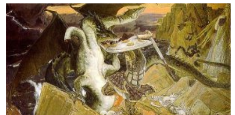
Иван Царевич хуячится. Васнецов живописует.

А что ожидает Добрыню Никитича после изничтожения Горыныча? Судя по всему — пустота, вакуум. Остаётся только прозябание с опостылевшей, безобразно располневшей женой. Мучительные годы каждодневных напоминаний тёщи-ведьмы, что первый зять «Хучь и не был чИЛАвеком, но деньгУ имел и сродственников жены уважал. Но вот, будь он неладен, пришёл эНтот нищоброд , хорошего зятя порешил, нашу Алёнку у него забрал. Наплодил бесприданниц. Одно горе с ним мыкаем».