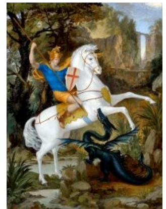
Пригламуренный вариант классического иконописного сюжета. Хана ящеруку.

Был на том месте большой дракон, и Вавилоняне чтили его. И сказал царь Даниилу: не скажешь ли и об этом, что он медь? вот, он живой, и ест и пьет; ты не можешь сказать, что этот бог неживой; итак поклонись ему. Даниил сказал: Господу Богу моему поклоняюсь, потому что Он Бог живой. Но ты, царь, дай мне позволение, и я умерщвлю дракона без меча и жезла. Царь сказал: даю тебе. Тогда Даниил взял смолы, жира и волос, сварил это вместе и, сделав из этого ком, бросил его в пасть дракону, и дракон расселся. И сказал Даниил: вот ваши святыни! Легко заметить схожесть данного способа уничтожения дракона с традиционным методом охоты эскимосов на белых медведей, когда заостренный и свёрнутый в кольцо китовый ус прячется в шарике из тюленьего жира. В желудке медведя жир тает, а ус, распрямляясь, прокалывает желудок. Как видно, аналогичным способом в древности пользовались и при охоте на драконов.