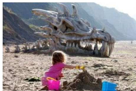
Неопровержимое доказательство существования драконов на британском пляже (спойлер: Реклама «Игры престолов»)