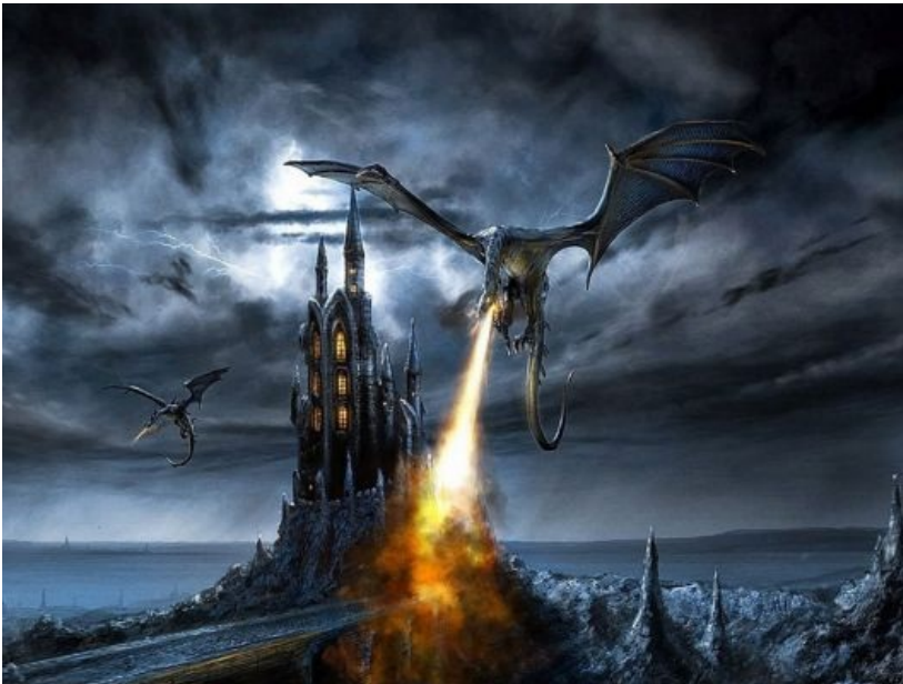
Kill it with fire