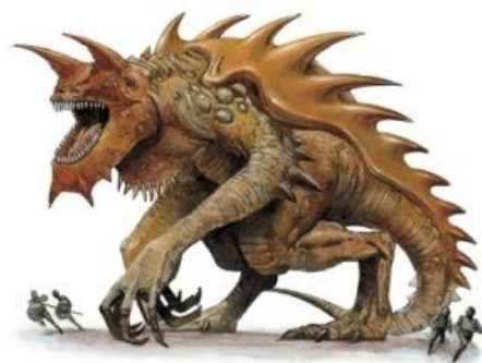
Зверь во всей своей красе

Но истинная сотона , ад и погибель всему живому — пятнадцатиметровый гибрид молоха с тираннозавром, наречённый тарраска — в честь, как нетрудно догадаться, жертвы Марты и Тартарена. Вносил его в рулбук расовый хранцуз и, похоже, постарался отыграть за обиженного соотечественника . Тарраска иммунен к любому незачарованному оружию, не боится огня и магии, регенерирует похлеще Дедпула , достаточно мелкие препятствия глотает целиком, недостаточно мелкие — кусает , топчет и душит . Говорят , эту тварь вообще невозможно убить : в третьей редакции требовалось свести его в −10 хитов и с помощью уберзаклинания «Желание» пожелать ему в таком состоянии и оставаться, в четвёртой уже при 0 хитов тарраска зарывается в землю — отсыпаться . Обычно зверик существует в единственном экземпляре и считается не то божественной карой, не то природным катаклизмом; впрочем, существовал квест с говорящим названием «Не ходи туда », где выигрышем было как раз не ходить к конечной цели , что и предлагалось приключенцам со всё нарастающей настойчивостью. Упрямцы, достигшие-таки цели , встречали в итоге сразу пять таррасков .