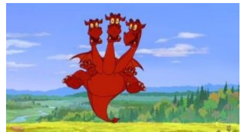
Да. Как-то так

Змей Горыныч — важная фигура в фольклоре, один из краеугольных «камней» Русской Сказки™, нередкий персонаж множества анекдотов — и заметьте, он не выступает опростоволосившимся ящером. Нет. Он мудр, логичен, объективен. При этом не ломается при общении с простым пиплом , как какой-нибудь зазнавшийся представитель высшего класса , поэтому может запросто: тяпнуть с мужиками водки , травануть байку , посмеяться над хорошей шуткой, слетать к девкам на гульбище, да ещё и пассажиров с собой прихватить, если попросят.