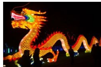
Дракон китайский, новогодний, с подсветкой. Недорого.

плавников. Морда крокодила гены, обязательно с длинными сомьими усами и, как правило, брежневскими бровями. С одинаковой лёгкостью плавают, бегают и летают, при этом крылья не способны полноценно их держать а скорее облегчают левитацию посредством Силы . В виде воздушных шариков и змеев любимые гости многих праздников Поднебесной .