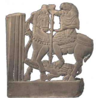
Древний Египет. Добрый и очень даже положительный бог Гор убивает злого и вообще нехорошего бога Сета в образе крокодила. Да, это называется «сеять зерно сомнения».