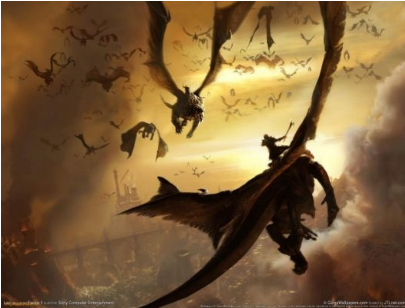
Люфтваффе какое-то, прости Господи