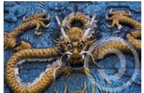
Или всё же тентакли ?

Сине-зелёный или лазурный дракон — эмблема Востока (запад символизирует белый тигр, север — чёрная черепаха [1] , юг — красный феникс, центр — жёлтый единорог [2] ).