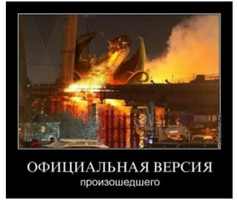
Возгорание деревянной опалубки на строящемся мосту через бухту Золотой Рог. Владивосток.

Это огненный дракон :) Огненный дракон выходит на связь