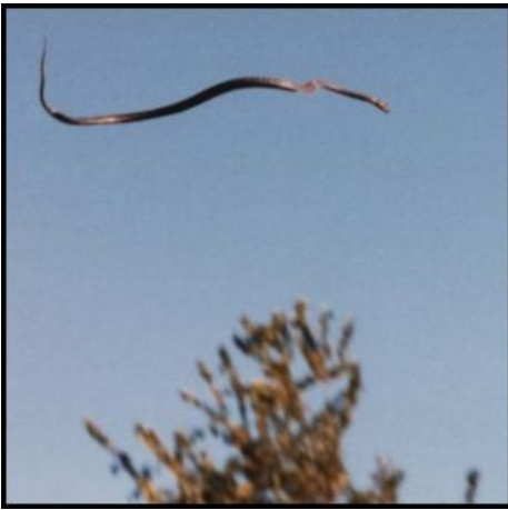
Золотистый древесный уж в воздухе

проявление Бога Кетцалькоатля, птица, благодаря ну ооочень длинному хвосту выглядящая в полёте как пернатый змей. • Дракон Ольма — в Средние Века считался личинкой дракона. • Наконец, мелкие ящерики .