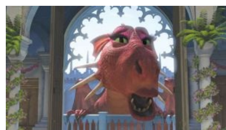
Чмоки всем в этом чате

https://www.youtube.com/v=Yze4iCrnd5k Охотники на драконов Смотреть Онлайн Без регистрации https://www.youtube.com/v=Mf9ZaVDeBmU Охотники на драконов 2008 jjnybrb yf lhfrjyjd 2008 Фильм