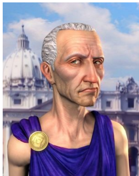
Хитрый Цезарь из Civilization