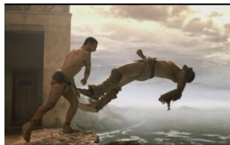
ЭТО КАПУЯЯЯ! Спартак в роли Леонида.

Бугаи-спартаковцы под Капуей легко расправились со слабенькими римскими силами, по сути — с местным ополчением. Потом, конечно, было не так легко, но ребята успели эпично погулять и поднять Италию на рога, оставив след в истории, равный ганнибальскому. Сначала разнесли вдребезги и пополам двух преторов с их войсками, через год, пройдя мимо Рима, проделали то же самое с пустившимися вдогонку консулами, у которых под командованием были элитные легионы, и пришли в Цизальпинскую Галлию. Но, когда Спартак прорвался на север Италии, рабы якобы воспротивились плану идти дальше и повернули обратно на юг. Насчёт причин этого спорят до сих пор. Сторонники марианской гипотезы указывают на то, что в 73 г. до н.э. Серторий был убит своим замом Перперной, который за 72 год умудрился просрать всю Испанию Помпею и лишиться головы, так что к моменту выхода Спартака к горам ловить у испанцев ему стало просто нечего. Как бы то ни было, гладиаторская армия от Альп развернулась обратно и снова направилась на юг Италии, опять