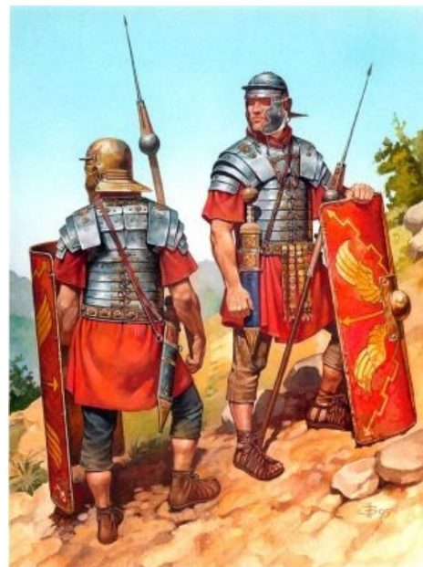
Брутальные легионеры высматривают очередной объект порабощения.

В религиозных делах римляне применяли радикальную тактику: просто переносили захваченных главных идолов соседних народов в Рим, причем римские жрецы отдавали новым богам все положенные почести и приносили богатые жертвы, а народ истово молился. Это колдунство называлось эвокацией , проводившейся римскими полководцами перед битвой или штурмом. Сохранился весьма доставляющий текст такой молитвы, где римская сторона объявляла вражескому богу, что, будь он хоть пеньком, хоть НЕХ , в Риме ему будут обеспечены все полагающиеся ништяки, и поэтому лучше бы ему по-хорошему перейти на сторону римлян , не то хуже будет. Бедным соседям ничего не оставалось, кроме как признать духовную власть Рима. Единственными, с кем это не сработало, оказались ЕРЖ — их Б-г пребывал вне этого мира, и украсть его было решительно невозможно. Хотя, судя по некоторым обмолвкам в «Истории» Тацита, проверенный веками метод при осаде Иерусалима римляне таки испробовали и даже были уверены в успехе. Кстати, а где у нас сидит Папа , наместник этого самого Б-га