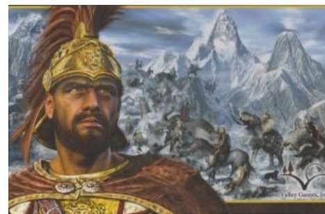
Ганнибал и его слоники в представлении игроделов

Поскольку у карфагенян кончились бабло, бухло и жратва, а римляне довили все сильнее и сильнее,