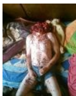
Выстрел в голову в упор из дробовика