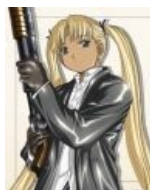
Триэла и её сраный Winchester Model 1897