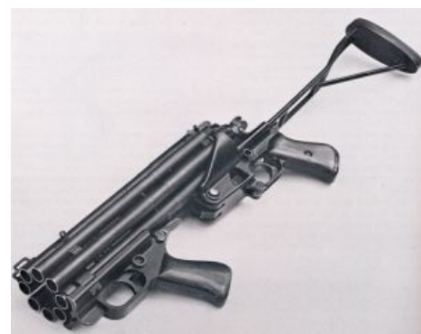
Обрез 80-го уровня Colt Defender MkI

Кстати, Кольт Дефендр и прочие многоствольники разрабатывались ещё и как дешёвое оружие для банановых республик, партизанов и просто любителей огораживаться. Ещё интереснее то, что конкоетно Кольт Дефендер позволял вести огонь и одиночными, и дуплетами. Именно так стреляет "помповый" дробовик в Half-Life , ирл, понятное дело, из помпы дуплетом не пострелять. Еще лулзовее то, что с дробью в Халф-лайфе все совсем как у обреза. А ещё "моссберг 500 крузер", заеченный в халф-лайфе, больше 6 патронов не вмещает, однако!