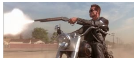
Арни на своем Харлее и с обрезом винчестера.