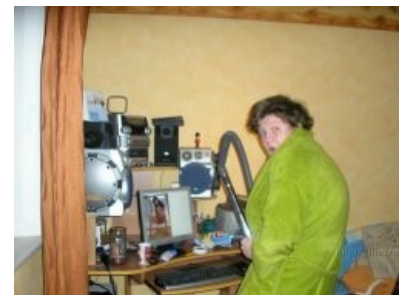
Все параграфы соблюдены