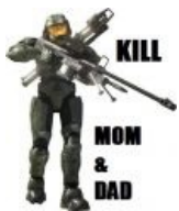
Advice Master Chief.