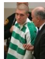
Воруй из отцовского сейфа, убивай родителей, задротствуй в Halo: я отмажу.