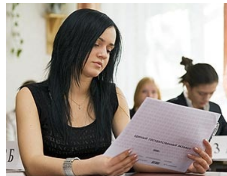
Бланк смотрит на ГК как на говно.