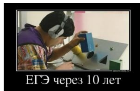
Прогноз для путинской Рашки.