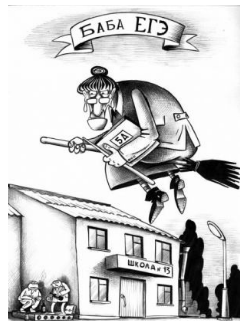
Тень нависла над Иннсмутом...

Однажды некий доблестный долбоеб вскрыл до экзамена конверт, который ему поручили отнести директору. И не только ведь вскрыл, но еще и умудрился выложить задания, находившиеся в этом конверте, в интернет. Распиздяйство преподавательского состава школы не позволило обнаружить факт вскрытия конверта еще до экзамена, поэтому после него, когда в