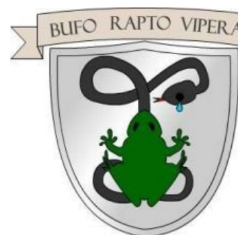
Говногеральдика (Правильно: Bufo viperam futuebat)