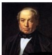
Саша Барон Ротшильд