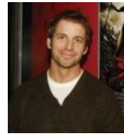
Зак Снайдер, режиссер. «Рассвет мертвецов», «300», «Хранители»