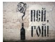
И на стене твоего дома