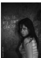
«Это мой собственный выбор»