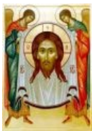
Самый знаменитый еврей

Тут таки собганы пгедставители нашего несчастного нагода