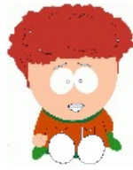
ЕРЖ Кайл Брофлофски