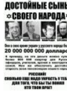
Смерть жидам (один таки уже)