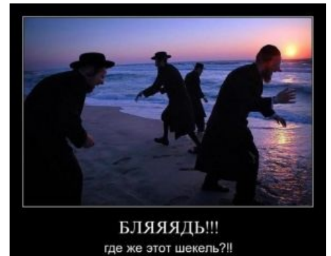
Их жадность известна всему миру

«В мире нет ни одного предмета, который не стоил бы китайцу для еды и еврею для фамилии »