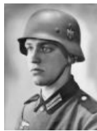
И ещё один