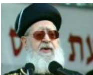
Еврейский инерасовый сефардский (испанский) раввин