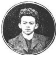
Типичный махровый ЕРЖ