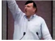
Стив «Developers» Баллмер