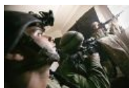
Еврейские расовые солдаты ЦАХАЛ