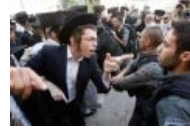
Кто жид, ты жид