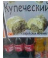
Еврейская начинка макеевского фастфуда