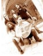
Кошерный митол Семья