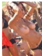
Еврейские расовые сиськи