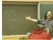
Столлман, обращающийся к Баллмеру