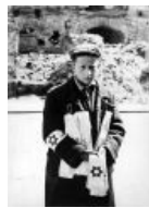
А вот кому звезду Давида?