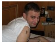
Еврейский расовый ахтунг