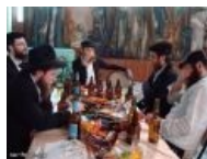
Пили пиво мужЪки