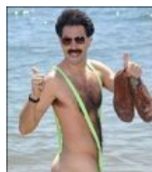
Борат ака Саша Барон Коэн, он же педик Бруно он же еврейский расовый ахтунг