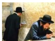
Еврейские расовые ортодоксы убивают себя апстену