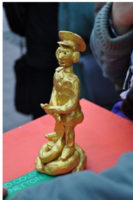
Статуэтка «Золотой Евсюк»