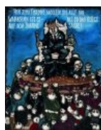
Картина Хейдиз из собрания Московского музея современного искусства.