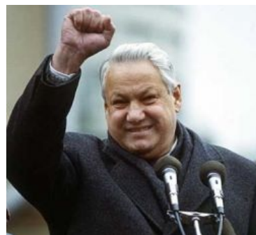
Еду в трамвае , понимаешь!

В 1989 году Борис едет в Пиндостан, дабы прочитать какие-то никому не нужные лекции. И сразу же по прилету с ним произошла оказия: едва спустившись по трапу, он ВНЕЗАПНО повернулся к самолету и поссал на колесо.