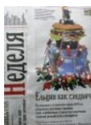
Говноизвестия пишут о памятниках ЕБНу.