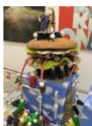
Скульптурный монумент Лены Хейдиз.