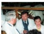
Ельцин и Аццкая сотона.