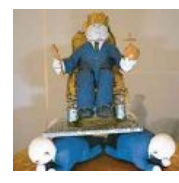
Фрагмент памятника ЕБНу работы Хейдиз.