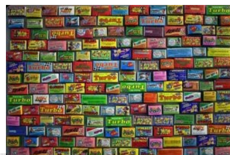
Жвачка. Много её.