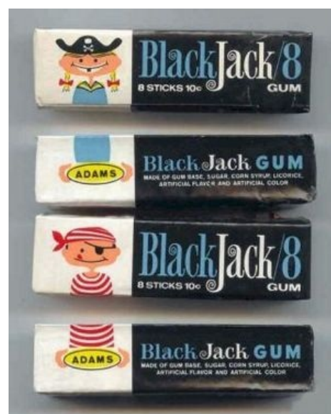
Шлюхи были после

В тридцатых годах двадцатого века Ригли изобретает хитрый план по увеличению продаж розовой массы