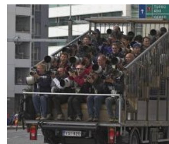
За сбором сырья