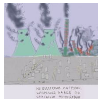
Тот самый завод