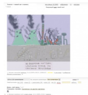
Пруффик авторства Аингера.