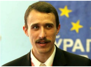
Рэжым заставляе Северинца глядзець БТ!

рэжымом в отдалённые деревни. Фееричные книги, полные ФГМ, патетики и белорусского национального чучэ доставят любому, кто читает по-белорусски.