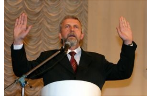
Сдаюсь! Меня раскрыли!

Александр Милинкевич ака Миля (в дороге) — начал в БНФ и даже упомянут у Василя Быкова. В лихие 90-е зампред Гродненского исполкома. С 1999 года стал «заслуженным оппозиционером», в перерывах между поездками к французам, немцам и прочим шведам встречается с Бацькой и обещает ему всё так же бороться за демократию.