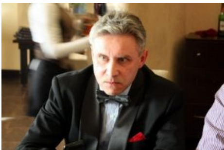
Поэт Адамович огорчён, что ты не