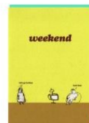
Здоровый британский нигилизм