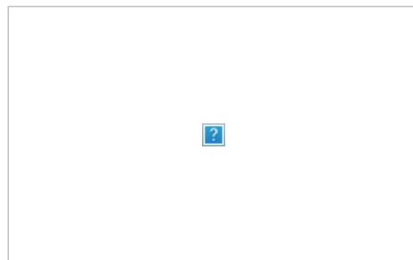
Оборотная сторона, замеченная на лепре