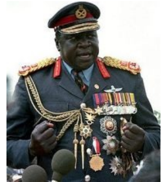
Черный Властелин Уганды повелевает

С 1946 года служил в британских колониальных войсках, где быстро получал повышения. Много занимался спортом, выиграл титул чемпиона Уганды по боксу, участвовал в соревнованиях по плаванию, играл в ногомьяч и регби. Промышлял контрабандой. В 1966, совершив госпереворот, стал главнокомандующим вооруженными силами страны. В 1971 разогнал нахрен всех остальных политиков и стал пожизненным президентом. В 1979 году был изгнан из страны и, будучи мусульманином, доживал жизнь в Саудовской Аравии, правда, чувствовал, что «народ в нём нуждается» , и порывался вернуться, но не успел. На канале Discovery сабж занял почётное место в сериале «6 Величайших Злодеев Мира».