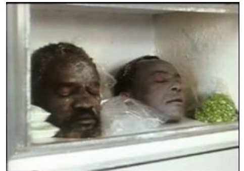
Запас на предмет похавать по ночам