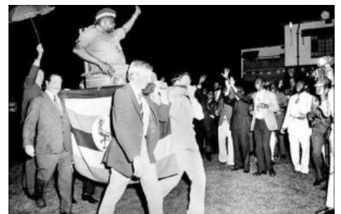
Бремя белого человека

EAT DA POO POO Другой замечательный угандиец Chimp with Machete Дал обезьянам мечи