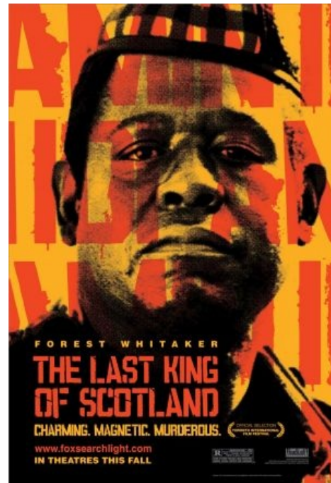
Последний настоящий король Шотландии