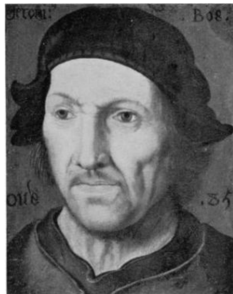
Приблизительный портрет Иеронимуса