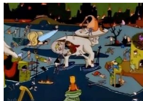
Это уже было в Симпсонах

Также картины Босха периодически используются различными музыкальными ВИА разной степени интересности: так, кусок «Страшного суда» швейцарские авангардисты от митола из Celtic Frost стянули для альбома «Into The Pandemonium», «Музыкальный ад» использован для оформления обложки диска «Deer Purple» 1969 г., что символизирует, а Deriche Mode по мотивам полотен Иеронима сотворили клип на песню «Walking In My Shoes» . Отметилась также группа Metallica с клипом на песню Until It Sleeps , вдохновлённым «Садом земных наслаждений» Босха. И даже Игорь Фёдорович , да! На обложке «Невыносимой лёгкости бытия» красуется «Искушение святого Антония» (не триптих, отдельная картина).