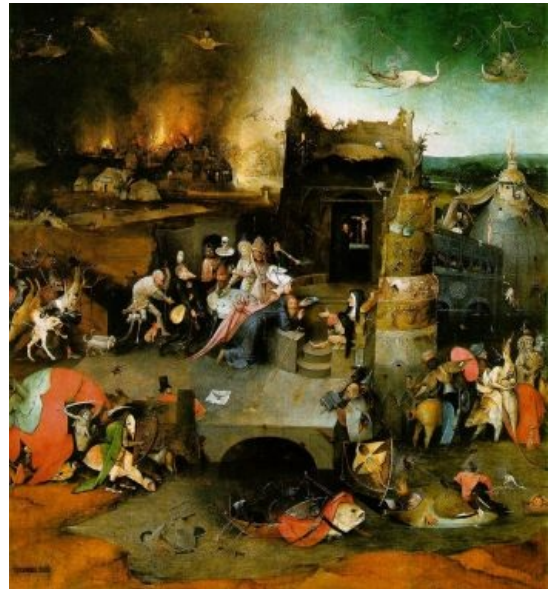
«Искушение святого Антония». Парад уродцев и монстров. К слову, «огнём святого Антония» в те романтические времена называли эрготизм, по мнению Абсентиса, ключевым образом повлиявший на творчество Босха