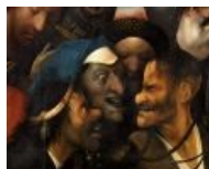
Хари и морды