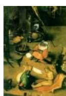
Верхом на рыбе