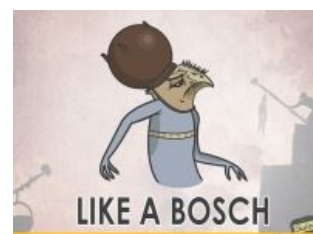
Like a boss

Включаем музыку для фона и читаем статью