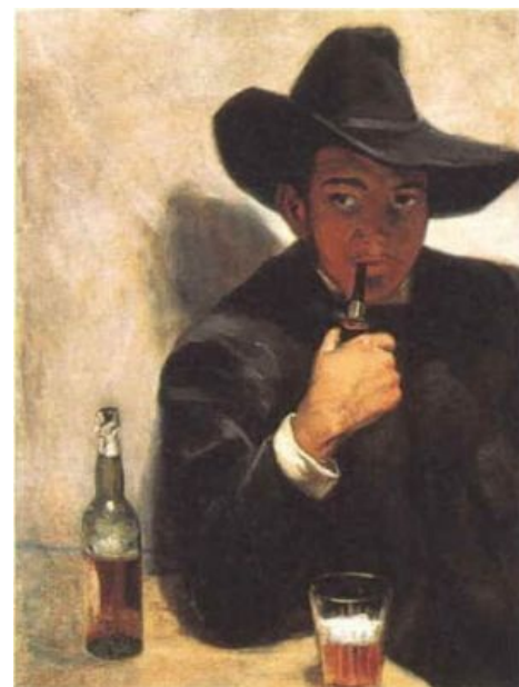
Диего Ривера. Возможный прообраз героя.