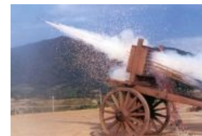
Стрельба из хвачхи — быстро и надёжно успокоит целый полк япошек

... а это WP 8, пшецкий вариант РПУ-14. Найди десять отличий