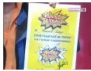
Расписка, которую давали участники