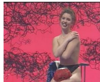
Довольная участница изображает стеснение

И вообще, Николай Владимирович — утонченный питерский эстет. Но его тонкий юмор 95% телезомби до лампочки. Им зрелищ подавай, чтобы танцовщицы стройнее были, участницы свежее и красивше. И конкурсов веселых не надо, и фоменковских шуток юмора можно поменьше. А сисястых участниц — много и сразу, чтобы прямо из-за кулис голышом выбегали и стриптиз показывали. Про желание Коляна потроллить телебоссов, которым главное — собственный пиар, никто и не догадывался. Пипл хавает , рейтинг растут. А пошлости на российских каналах тогда уже было через край. И люди будут ее смотреть, потому что привыкли. Просто нужно с головой в дерьмо нырнуть, тогда и поймешь, что потонешь в нем.