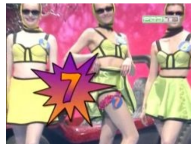
На кону семь снятых шмоток

Правила игры очень просты: приглашается пара участников — парень и девушка, которые сначала выбирают номер одной из шести танцовщиц, у которых под юбкой на правой ноге прикреплен кружок с числом предметов одежды. Какой номер выпадет, столько должен снять с себя проигравший . Для мужиков Колян часто делал своеобразный подарок — позволял самим туда заглянуть и приподнять. Если выбирать нужно было даме, ведущий делал это сам или приказывал поднять юбку танцовщице, перед процессом максимально покривлявшись. В случае ничьей побеждает дружба раздеваются оба участника.