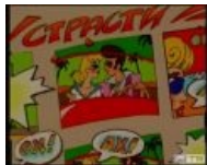
Комикс из заставки