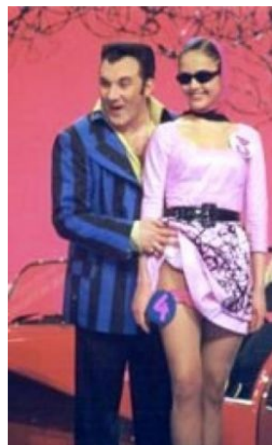
Кому-то придется снять четыре предмета одежды

Зрителями в студии были в основном люди в малиновых пиджаках , а также их содержанки . В одном из выпусков замечен человек кавказской национальности, похожий на молодого Сосо Павлиашвили . К сожалению, тогда Интернет ы были в зачаточном состоянии, и узнать, кто и как на самом деле участвовал