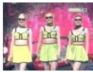
А тут вспомнила. Ляп?