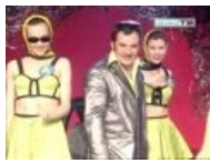
Танцовщица № 5 забыла надеть очки