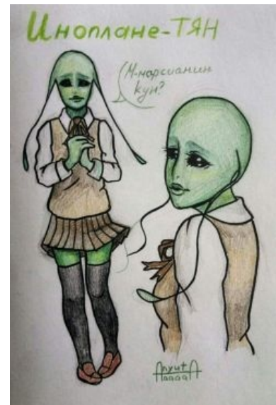
Иноплане-тян. Свой маскот есть и для настоящего сабжа, пусть пока и на стадии набросков.

И у них тоже есть программа SETI по поиску разумных существ, которые каждый день выпрыгивают из воды в надежде обнаружить, что кто-нибудь выпрыгивает из воды в постоянном ритме. Конечно, они не могут не заметить, что и под водой, и над водой плавают какие-то деревянные и железные штуки. Но они ведь не выпрыгивают туда-сюда, значит неразумны.